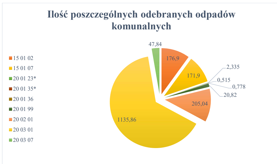
Wykres nr 1. Ilość odebranych odpadów komunalnych z nieruchomości położonych na terenie Gminy Miejskiej Hel